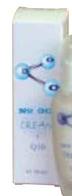
Pleťový krém No.300 s koenzymem Q10 (30 ml) obsahuje navíc dexapanthenol a vitaminy. Nanáší se na vlhkou pokožku, nejlépe po koupeli, a lehce se vtírá do pokožky obličeje, krku a dekoltu. Je vhodný jako noční krém, ale snese i denní naličení