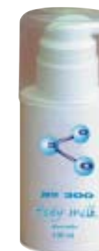
Tělové mléko z řady No.300 (100 ml) se aplikuje na pokožku celého těla, regeneruje ji a léčí. Je vhodné i k odlíčení