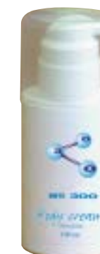
Tělový krém No.300 (100 ml) se rychle vstřebává, má dezodorační, antimikrobiální a regenerační účinky. Jeho použití je univerzální